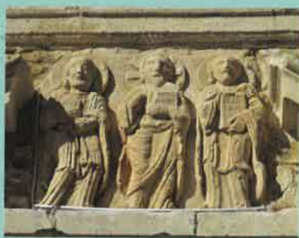
À gauche tétramorphe* entourant l'agneau, à droite le Christ entre saint Pierre et saint André.

Le PETR Garrigues et Costières de Nîmes réalise un inventaire du patrimoine afin de mieux connaître l'histoire et les richesses des 44 communes qui le composent. Cette démarche s'inscrit dans le cadre d'un partenariat avec l'Inventaire Régional Occitanie et se décline en 3 actions :