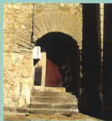
Détail de l'arc en plein cintre médiéval.